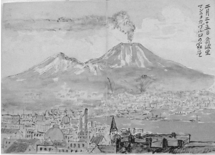
「イタリアの風景スケッチ」(荒木俊馬筆) 京都産業大学 大学史編纂室所蔵

2017年、荒木俊馬総長 生誕120周年を迎えました。これまで京都産業大学ギャラリーでは、荒木総長が大学創設に尽力した姿を数多く紹介してきました。今回は荒木総長の学生時代や研究者としての顔に焦点をあて、どのように青春を謳歌し、何を見て過ごしてきたのか、その素顔に迫ります。