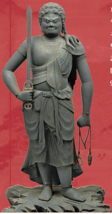
重要文化財 木造不動明王立像(本尊) 平安時代 聖護院蔵

京都洛東に伽藍を構える聖護院は、出家した皇族が住職をつとめてきた門跡寺院です。そのため、境内の書院や宸殿には、金色に輝く華麗な障壁画が100面以上伝えられています。また、聖護院は本山修験宗の総本山でもあり、勇壮な山伏たちの寺として、修験にかかわる仏教美術が多く伝えられています。2014年は、聖護院の開山・増誉大僧正(1032~1116)の900年遠忌にあたり、御遠忌法要が厳修されました。これを記念し、聖護院および本山修験宗の名宝を披露する展覧会を、龍谷ミュージアムと京都文化博物館で同時開催する運びとなりました。寺外初公開を含む約140件(うち国宝1件、重要文化財13件)を展示し、聖護院900年の歴史と文化、その魅力の神髄を余すところなく紹介します。