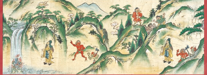
箕面寺秘密録起(巻中、部分) 江戸時代 大阪・瀧安寺蔵