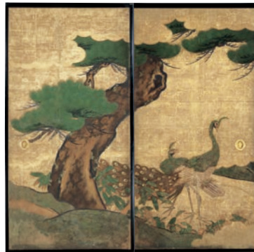
孔雀図襖(部分) 江戸時代 聖護院蔵