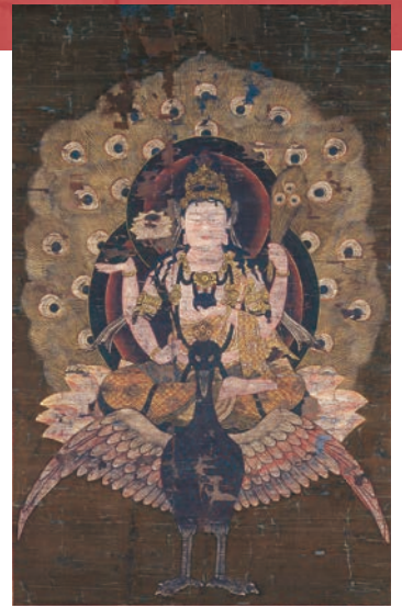
孔雀明王像 室町時代 聖護院蔵