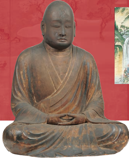
重要文化財 木造智証大師坐像 平安時代 聖護院蔵

京都洛東に伽藍を構える聖護院は、出家した皇族が住職をつとめてきた門跡寺院です。そのため、境内の書院や宸殿には、金色に輝く華麗な障壁画が100面以上伝えられています。また、聖護院は本山修験宗の総本山でもあり、勇壮な山伏たちの寺として、修験にかかわる仏教美術が多く伝えられています。2014年は、聖護院の開山・増誉大僧正(1032~1116)の900年遠忌にあたり、御遠忌法要が厳修されました。これを記念し、聖護院および本山修験宗の名宝を披露する展覧会を、龍谷ミュージアムと京都文化博物館で同時開催する運びとなりました。寺外初公開を含む約140件(うち国宝1件、重要文化財13件)を展示し、聖護院900年の歴史と文化、その魅力の神髄を余すところなく紹介します。