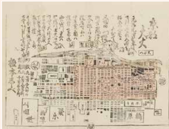
《元治元年京都大火図》