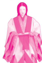
女性装束 「玉鬘」歳暮の衣配の場面 京都宮廷文化研究所蔵