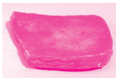
「蒔絵硯」 京都市考古資料館所蔵