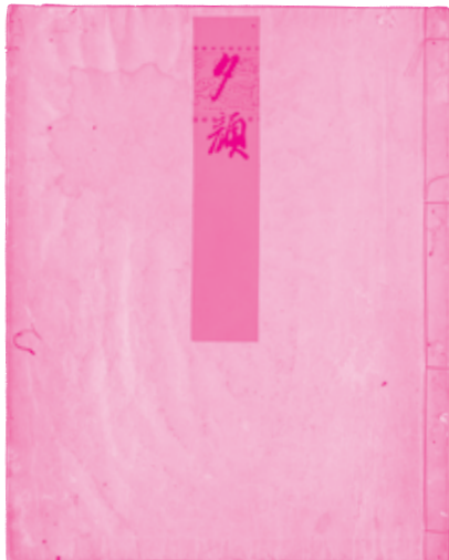
『源氏物語』五十四帖「夕顔」 大覚寺所蔵