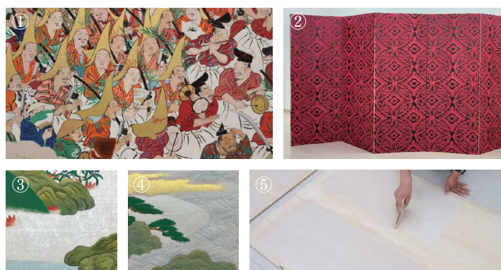
1:復元本「月次祭礼図屏風」六扇部分 2:復元本「石山寺縁起絵巻」画中画「浜松図屏風」裏地 3:「四季花木図屏風」技法試作 4:旧里見家本「浜松図屏風」技法試作 5:雲母地

科研費 本研究はJSPS 科研費JP22H00628「中世やまと絵屏風の技法復元を中心とする総合的研究」(阪野智啓)・JP22K00212「中世大画面祭礼図の構図法の研究—月次祭礼図屏風模本の失われた左隻の推定を中心に—」(岩永てるみの助成を受けたものです)