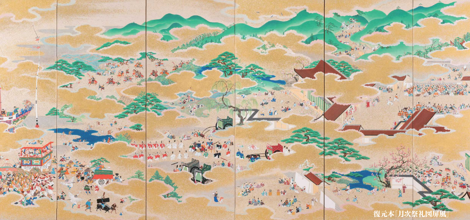
復元本「月次祭礼図屏風」