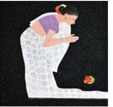
黒色黒光(流灯) 2021年 2曲1隻 個人蔵