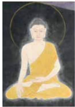
成道の刻 2019年 1幅 真宗大谷派(東本願寺)蔵