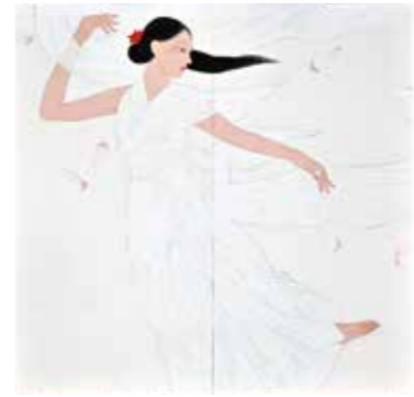
白色白光(風舞) 2020年 2曲1隻 個人蔵