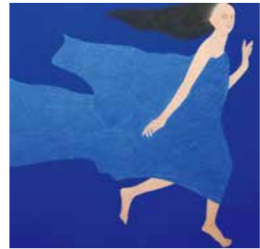
青色青光(問躰) 2021年 2曲1隻 個人蔵