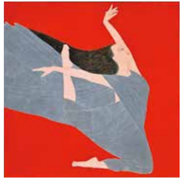
赤色赤光(跳躰) 2020年 2曲1隻 個人蔵