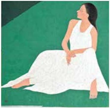
緑色緑光(山水) 2021年 2曲1隻 個人蔵