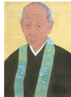
信明院殿肖像 2020年 1幅 個人蔵

一般来館者の予約方法 ご来館にあたっては、事前予約が必要となります。※本学学生および教職員は予約不要です。