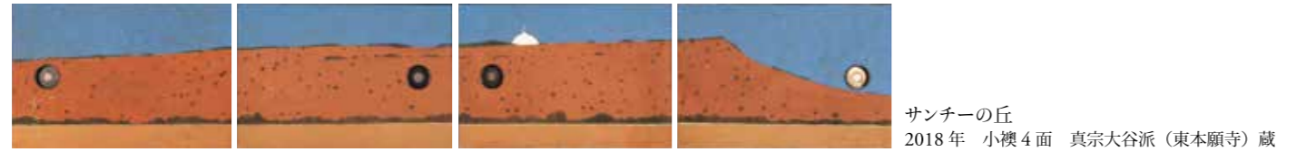
サンチーの丘 2018年 小襖4面 真宗大谷派(東本願寺)蔵