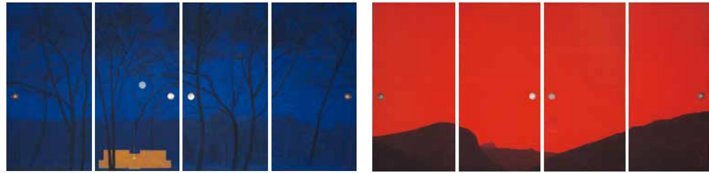
祇園精舎香堂趾寂静 2018年 襖4面 真宗大谷派(東本願寺)蔵