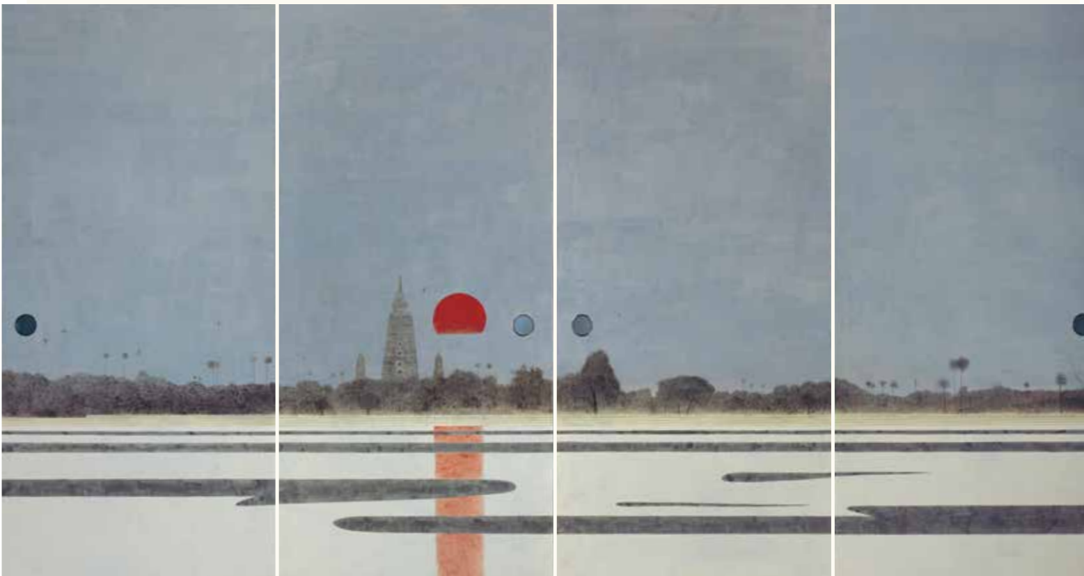
畠中光享 (成道聖地拝陽) (部分)