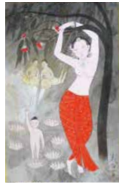
誕生仏 2020年 1幅 真宗大谷派(東本願寺)蔵