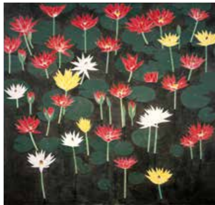
安養花 2013年 2曲1隻 個人蔵