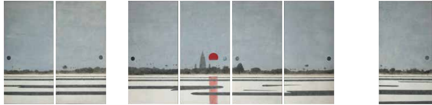
成道聖地拝陽 2018年 襖7面 真宗大谷派(東本願寺)蔵

昭和22年(1947) 奈良県の真宗大谷派寺院に生まれる。大谷大学文学部史学科を卒業の後、京都市立芸術大学専攻科修了。昭和52年(1977) 第21回シェル美術賞、昭和53年(1978) 第1回東京セントラル美術館日本画大賞、平成16年(2004) 第22回京都府文化賞功労賞、平成26年(2014) 京都美術文化賞など受賞歴多数。全国各地で多数の展覧会・個展を開催。仏教に造詣が深く、仏教的主題の作品を制作する。また、毎年インドの仏跡などを訪れ、インド美術研究者としても知られる。Artist Group一風メンバー、東方学院講師。