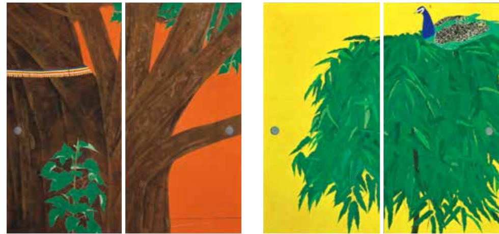
菩提樹白道 2019年 襖2面 真宗大谷派(東本願寺)蔵