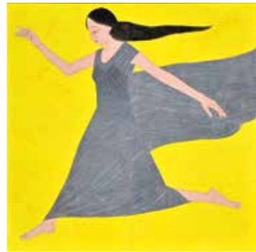
黄色黄光(駆走) 2020年 2曲1隻 個人蔵