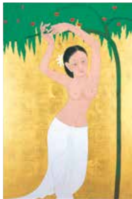
マーヤ (部分) 2016年 パネル1面 個人蔵