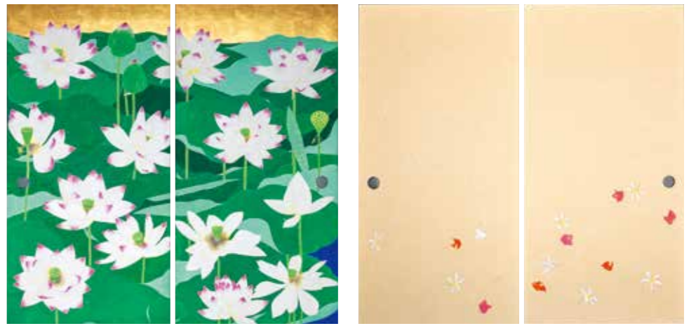
蓮華図 2018年 襖2面 真宗大谷派(東本願寺)蔵