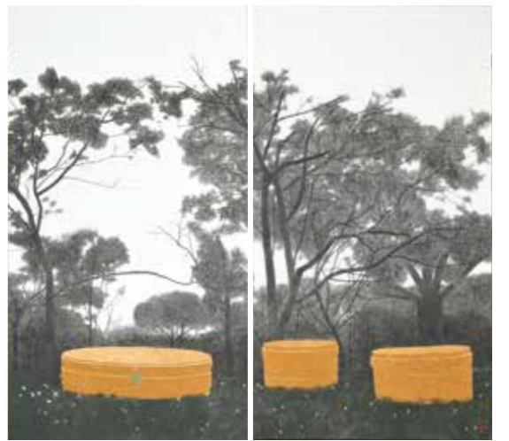
祇園精舎趾の奉獻塔 2021年 襖2面 勝願寺蔵