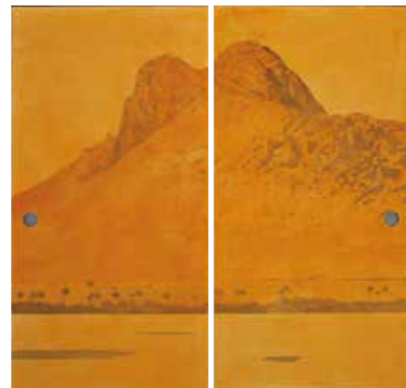
前正覚山光輝 2019年 襖2面 真宗大谷派 (東本願寺) 蔵