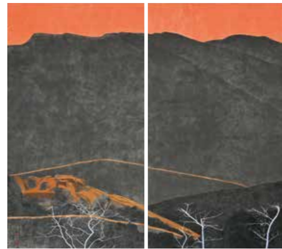
仏説霊鷲山 2021年 襖2面 勝願寺蔵