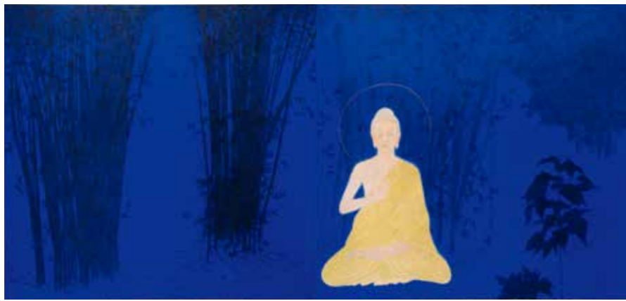
竹林精舎の説法 (晨朝) 2014年 2曲1双 個人蔵